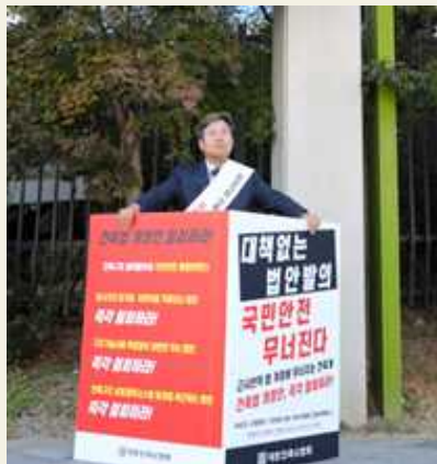
국토부 앞 1인 시위