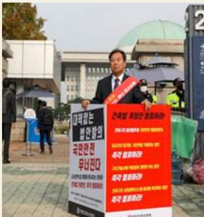
국회 앞 1인 시위