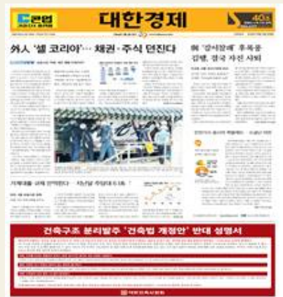
대한경제 반대성명서 게재