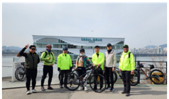
3월 한강 라이딩