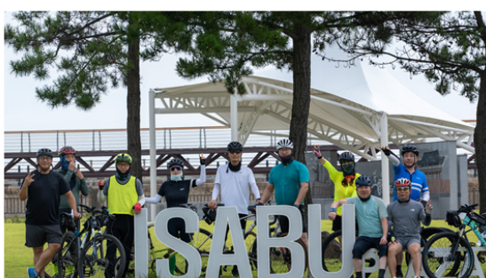
2023.08 자전거 동우회에서 1박 2일 동해안 자전거길 라이딩