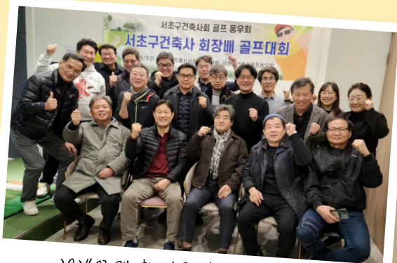
2024.03 제2회 서초구건축사 회장배 골프대회