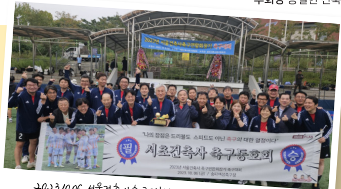
2023.10.06 서울건축사축구연합회장기 축구대회에서 우승한 날