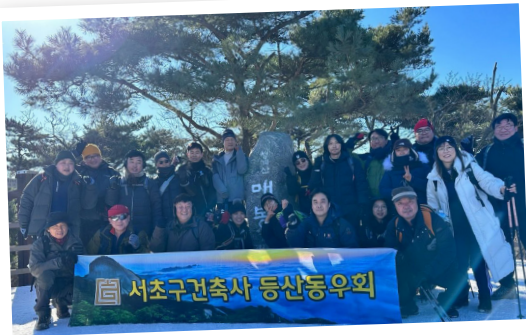
2023.12 등산 동우회와 청계산 송년산행