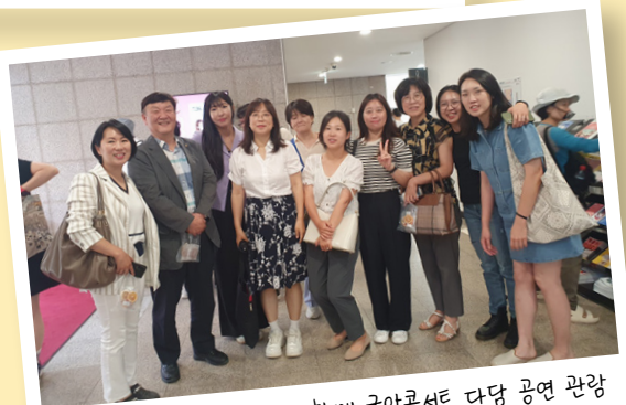
2023.07 서화담 동우회와 함께 국악콘서트 다담 공연 관람