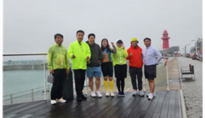
4월 시화호 방조제길 라이딩

올해 첫 정기모임인 3월 라이딩은 서울시민에게 가장 사랑을 받는 장소 중 한곳인 한강을 양재에서 출발하여 여의도까지 왕복하였습니다. 4월 6일은 임실군에서 개최된 옥정호그란폰도 대회에 참석하여 기간 갖고 닦은 실력을 맘껏 뽐내고 왔습니다. 4월 라이딩은 바다를 가르듯한 기분을 만끽할 수 있는 시화방조제길을 달리러 갔으나 기상변화로 아쉽게도 맛있는 식사를 하며 즐거운 단합회를 하였습니다. 5월은 서판교 확장코스를 달리며, 특별히 6월에는 대마도 라이딩을 가기로 예정 되어 있습니다.