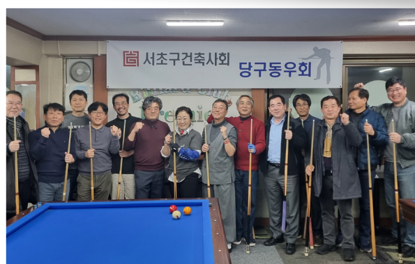
2024.02 당구동우회 발대식